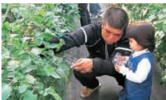
昨年の消費者交流会におけるミニトマト収穫体験の様子

南部地区農業青年クラブ連絡協議会では、一般消費者に、農作物がどのように生産されているのかを知ってもらうため、毎年三月に消費者交流会を実施しています。