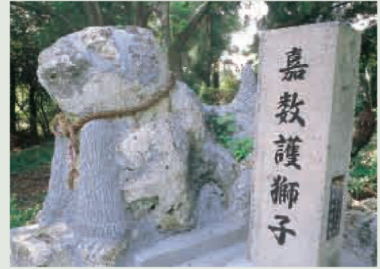
新たに建立された石獅子