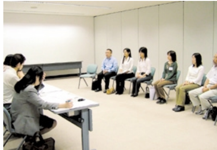
グループ面接では、外国語による質問も行われました

今回の総会開催のため、県内外から約六百名のボランティア応募がありました。 平成十六年十一月十三日と平成十七年一月八日の二回に渡り、沖縄県産業支援センターで行われた「ボランティア面接会」には、高校生から最高七十歳代の方まで幅広い年齢層が参加し、中には親子揃っての面接もありました。