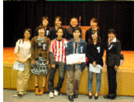
スペイン語弁論大会に出場した十名の大学生弁士たち。優勝者にはフィリピン旅行の航空券がプレゼントされた

IDB 沖縄総会を記念し、「第五回スペイン語弁論大会」(SHURYU主催、IDB実行委員会共催)が一月二十二日(土)、浦添市産業振興センター「結の街」で開催されました。IDB 実行委員会の奥山事務局長は「沖縄県は、中南米諸国をはじめスペイン語圏に多くの移民を輩