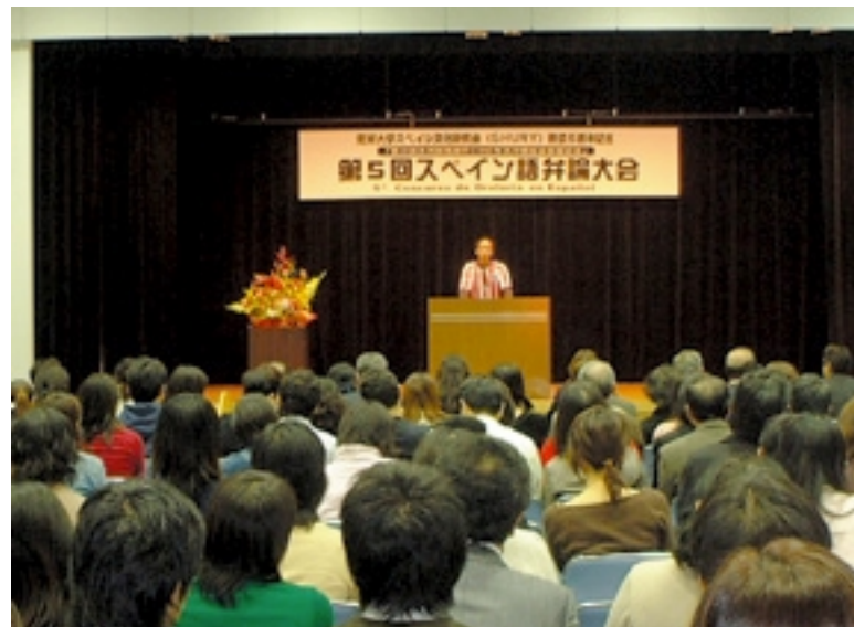
流暢なスペイン語が披露された弁論大会

琉球大学スペイン文化研究会(SHURYU)創立五周年記念 第四十六回米州開発銀行(IDB)年次沖縄総会開催記念