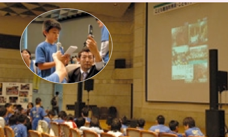
TV電話を利用して離島の子ども達と交流