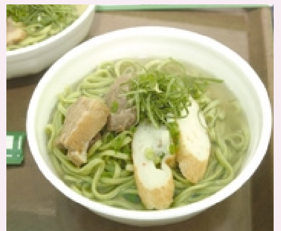
(写真下) 与那国島に多く自生する長命草