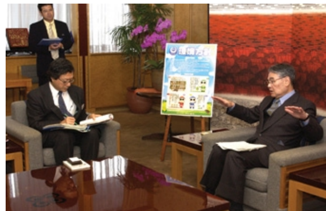
最終審査を受ける環境管理統括者の稲嶺知事（平成17年2月1日）

県庁本庁舎のISO14001（環境マネジメントシステム）の国際規格）認証取得に対し、三月七日、登録証が授与された。 県政の重要な施策の一つである環境問題。本県では、平成十五年十月にISO認証取得を宣言してから、全職員に対し各種研修を実施し、県の活動が環境配慮の下に行われるよう環境マネジメントシステムの構築作業等を行ってきた。昨年末から数回にわたり段階的審査が行われ、今年二月初旬の最終審査を経て、二月