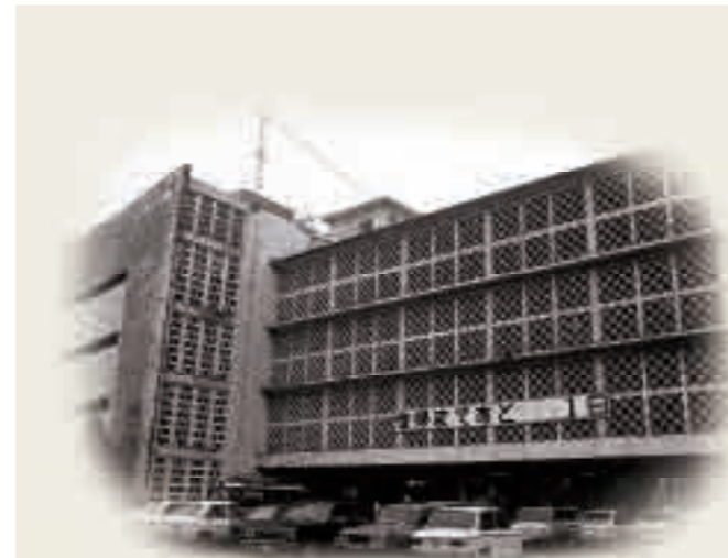
復帰へのカウントダウン 1972年5月14日

第一庁舎に掲げられた「復帰まであと1日」の表示板