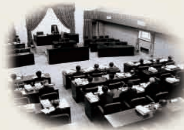
あかつきの本会議 1972年5月15日

第一庁舎に掲げられた「復帰まであと1日」の表示板 (琉球政府関係写真資料 040370)