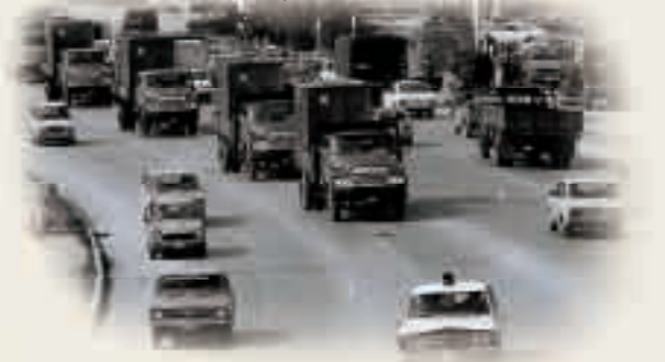
1号線を走る通貨切替用の円を積んだトラック 1972年5月2日

分から開かれた初の県議会では、県発足 に必要な条例案や予算などについて審 議が行われ、沖縄県の体制が整えられ ました。県庁舎前では、開庁式と「沖縄 県庁」表札の除幕式が行われました。 また、日本政府は、復帰記念式典を那 覇と東京で開催し、国家行事として沖 縄の復帰を祝いました。復帰に際し、政 府は沖縄の産業基盤や教育施設などの 整備を図るため、「沖縄の復帰に伴う特 別措置に関する法律」などで国庫補助 の優遇措置をとりましたが、県民が望 んでいた米軍基地撤去などの問題は未 解決のままです。 県民は真の平和実現に向けて新たな 決意をし、新生沖縄県誕生の日を迎え たのです。