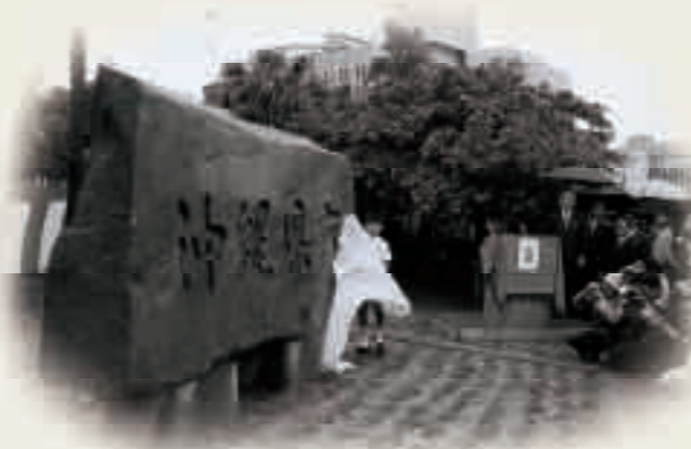
沖縄県庁除幕式 1972年5月15日

初の県議会である昭和47年第1回沖縄県議会(臨時会) (琉球政府関係写真040364)