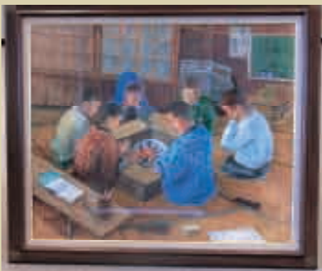
火鉢で暖をとる学童たち(宮里宏さん作) 数十年ぶりという氷点下の寒さに疎開者は震えました。

激しい戦火を避けるための疎開は、九州 地方の宮崎県、熊本県、大分県や台湾にま で及びました。約八万人が疎開したといわ れています。 本企画展では、疎開者の方々の協力によ り収集した疎開先での写真や当時の持ち物 などを公開し、当時の状況を紹介します。 戦後六十年が経 ち戦争体験者は高 齢化していますが、 戦争の記憶を遠い過 去の出来事にしない ためにも、本企画展 が平和の尊さを考え るきっかけとなれば と思います。