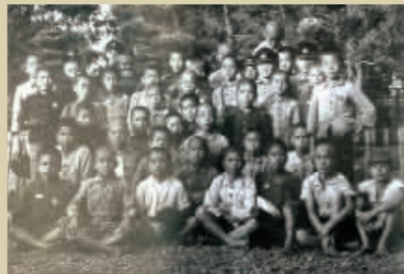
喜舎場国民学校の学童たち 熊本県山鹿町の温泉旅館に宿泊し、山鹿国民学校で学びました。