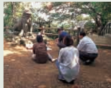
竈御願の日に区民に拝まれている石獅子

富盛の石獅子は最大最古のもので旧暦十月一日には竈御願(カマウガン)で拝まれ、火山として恐れられた八重瀬岳は今では南部の桜の名所として賑わっている。