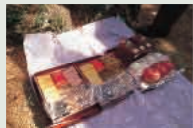
竈御願のお供え物