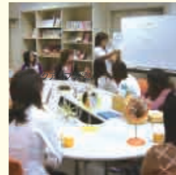
メイクアップ講座セミナーの様子

「履歴書の書き方」や「面接の受け方」、「仕事理解の促進」などについて直接指導を行ったり、受講者同士が意見交換するグループワークを盛り込んだセミナーを実施しています。