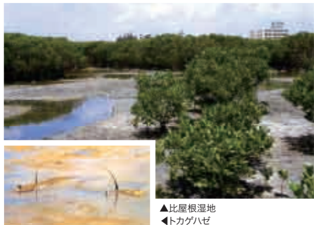
▲比屋根湿地 ▲トカゲハゼ

人工島南側には、海水浴場のない沖縄市に、全長約八百メートルの人工海浜(ビーチ)を創造します。海洋性レクリエーション空間を整備しながら、オカヤドカリなどの生息環境に配慮した自然