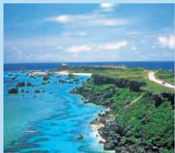
日本百景の1つ「東平安名岬」