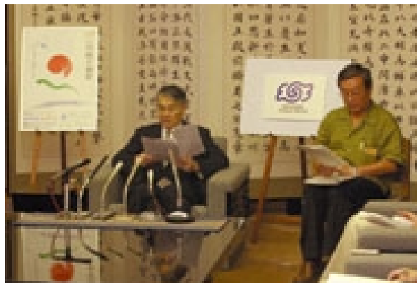
第2回平和賞の受賞者を発表する稲嶺知事