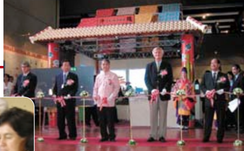
オープニングセレモニーでのテープカット