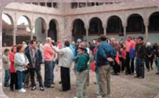
ペルーの観光名所をめぐるツアー

さらに、ウェルカムドリンクとして「ヒスコサワー」(ペルーの有名なアルコール入飲料)が振る舞われ、その後はペルー料理をバイキング形式で自由にいただくながら、民族舞踊や音楽とともに楽しいひとときを過ごしました。 さて、IDB沖縄総会では世界四十六カ国から来県される総会参加者及び同伴者をどのようなイベントで歓迎することができるのでしょうか。沖縄自慢の歌や踊り、料理にはじまり、伝統工芸の数々と観光スポット。IDB総会の開催を機に初めて来県される外国の方も多いため、一人でも多くの沖縄ファンを獲得するべく、沖縄らしさを全面に出したイベントを企画します。