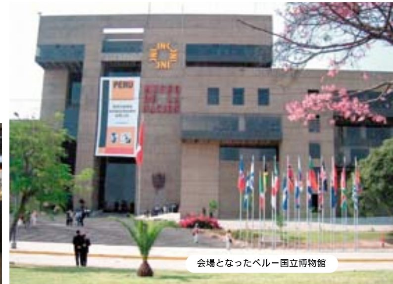
会場となったペルー国立博物館