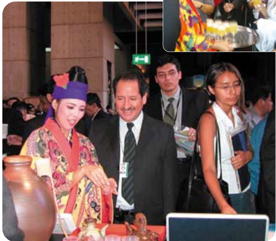
沖縄PRブースで泡盛を試飲する参加者

を映像やパンフレットで紹介し、総会参加者で大変賑わいました。 オープニングセレモニーにおいても県人会の全面的な協力により琉球舞踊が披露され、獅子舞の演舞が続くと大きな人垣が出来、会場は大いに盛り上がりました。 総会参加者からもかなりの反響があり、次回開催地沖縄を十分にPRすることが出来たと確信しています。