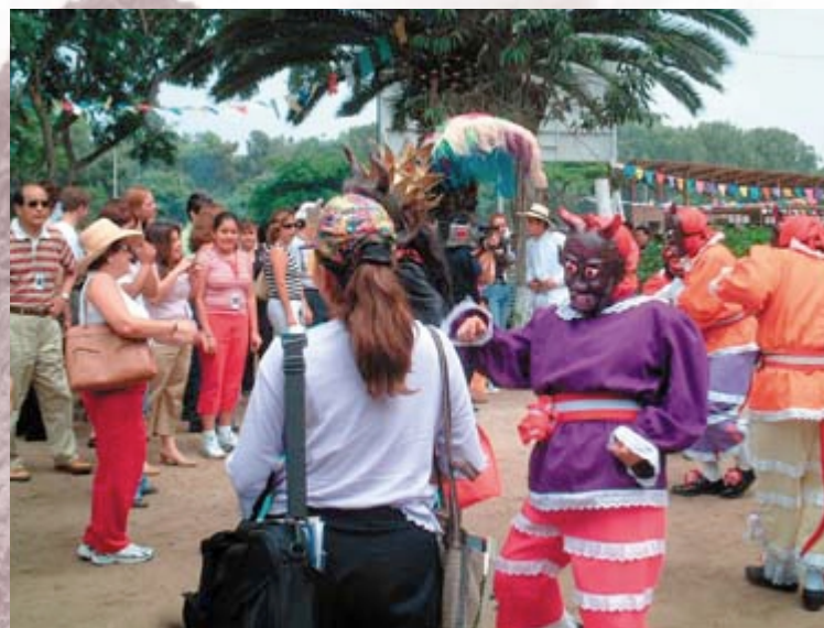
イベント会場に到着した総会参加者を伝統芸能で歓迎

IDB年次総会は、会議のみが行われるわけではありません。総会へ出席する会議参加者はもちろんのこと、多くの同伴者(夫人・子供)も訪れるため、開催地では多くの無料イベント(ツアーやレセプション)を用意し、皆が楽しめるよう、工夫を凝らしています。 ペルーで行われたイベントの一例が「カントリーランチ付きペルー民族祭り」です。これは野外でペルー料理を味わいながら、ペルーの民族芸能を堪能するというもので、会場では、お面やカラフルなコスチュームを身にまとったペルー独特の鬼ダンスと音楽隊の演奏の歓迎を受けました。