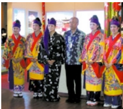
ペルー県人会による琉装ボランティア