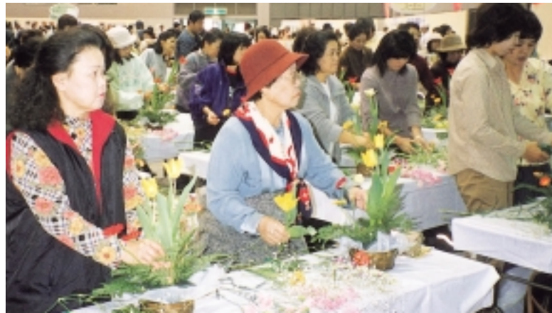
フラワーアレンジメント講習会

林産物コーナー きのこ料理の試食/きのこ販売/木製玩具の制作講習/キット販売/竹炭製品の展示・販売を実施します。