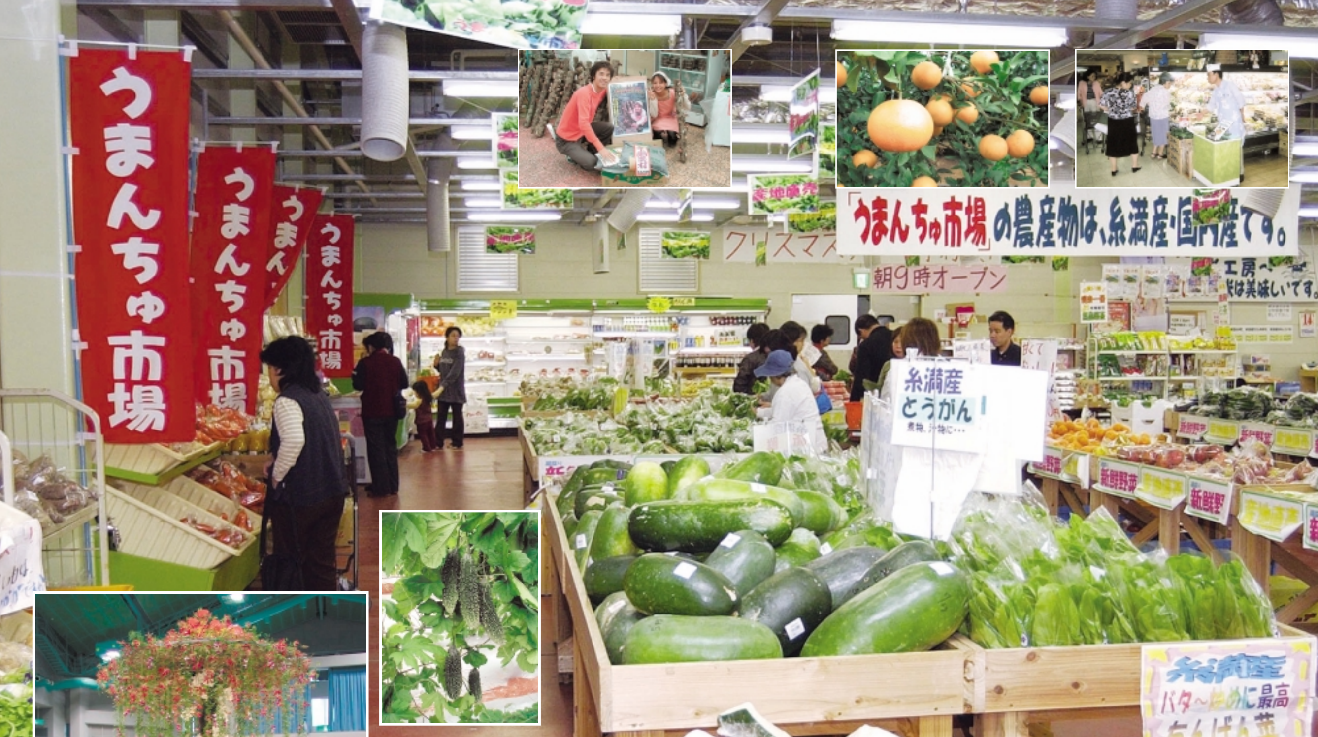
活気づく農産物直売所

食卓で「旬」を感じたことはありませんか。近年、季節を問わずほとんどの農産物が店頭に並び、食べられるようになったことに加えて、ライフスタイルも多様化し、家庭における調理や食事を中食や外食で代替させるなど、消費者の農産物への関心が低下し、「食」と「農」の結びつきが弱まっているように思えます。