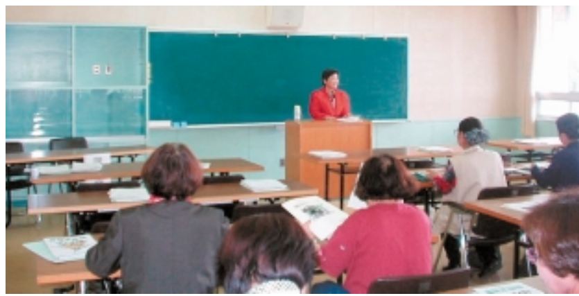
食育推進ボランティア講習会