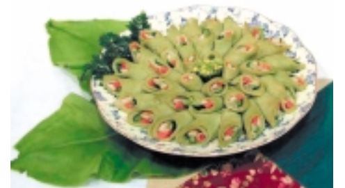
県産ゴーヤー ひらやちの巻物