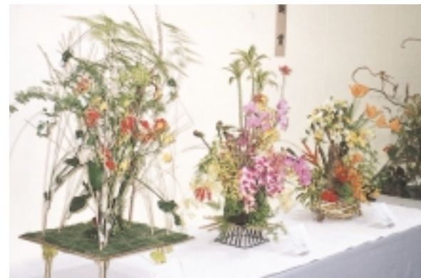
フラワーデザインコンテスト