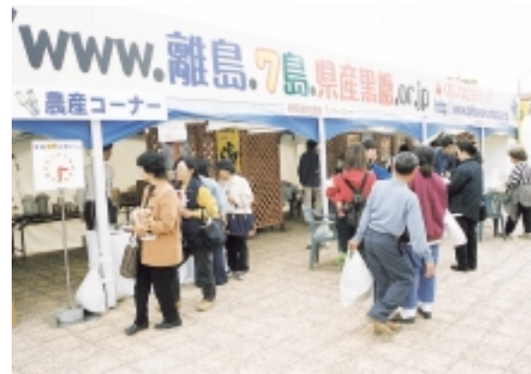
さとうきび・糖業コーナー