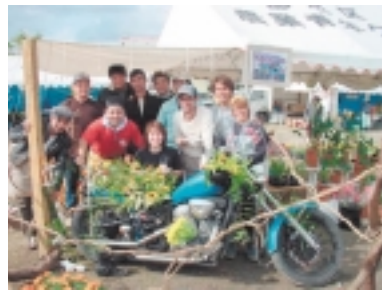
ヤングファーマーズコーナー