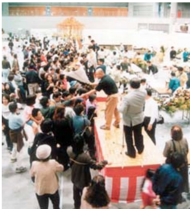
フラワーオークション