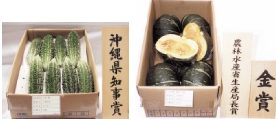
野菜品評会(ゴーヤー、カボチャ)