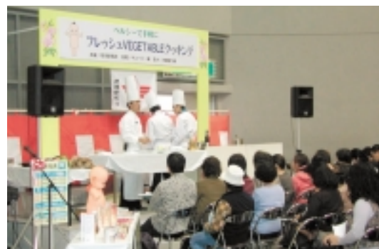
フレッシュBEGETABLEクッキング