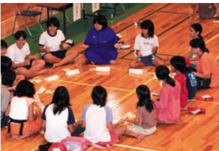
おいしい食事の後の交流会。渡名喜島の子も探検隊の子も関係なし。仲良くなるのは