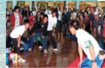
結団式。これからの探検に気合いを込めて、みんなで「チクサクコール」!