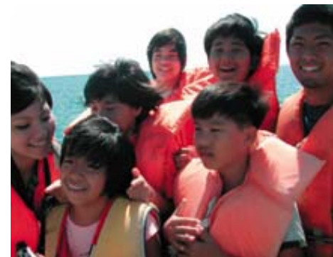
はての浜の帰りの船。もうみんな仲良し

全国的な沖縄ブームの中、テレビの全国放送では、沖縄の離島を舞台にしたドラマが視聴率をかき、食や旅の情報番組で先島の風景を見ることも多くなりました。観光客も年々増えているようです。でも知っていますか。透き通るような海や白い砂浜、亜熱帯の力強い緑や色とりどりの花といった豊かな自然。島独自の踊りや祭りなど独特の文化。ゆったりと流れる時間。温かい人情。島には魅力があふれています。 十月十一日から十四日の三泊四日の日程で、県内の児童生徒による