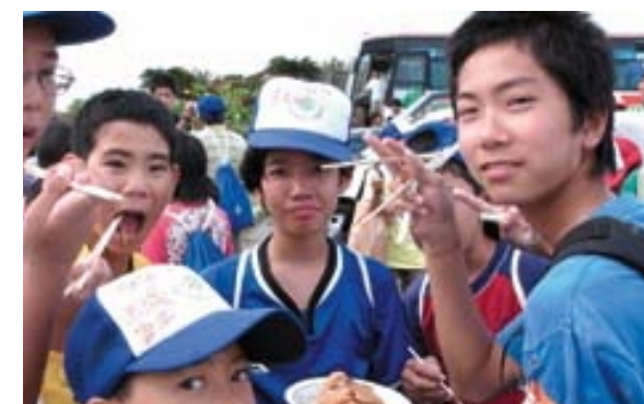
ついに刺身になりました。「いっただっきまーす」