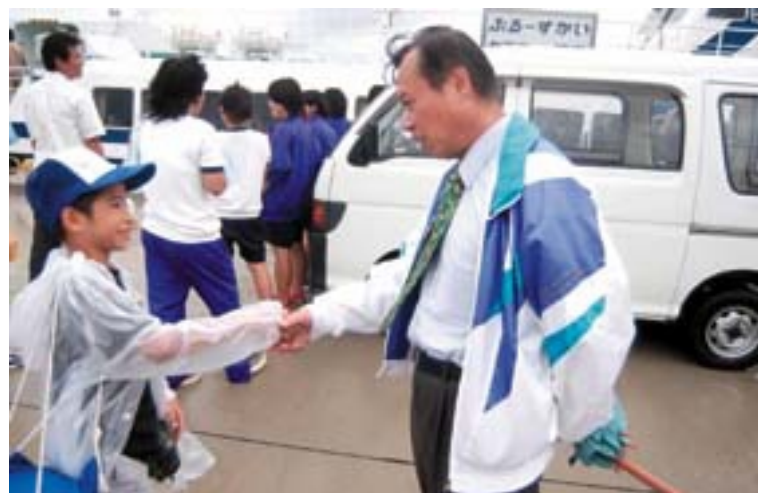
渡名喜島とも今日はお別れ。「また島に来てね」と校長先生