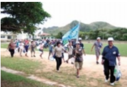
渡名喜島へ上陸。さて、どんな子どもたち、思い出が待っているんだろう