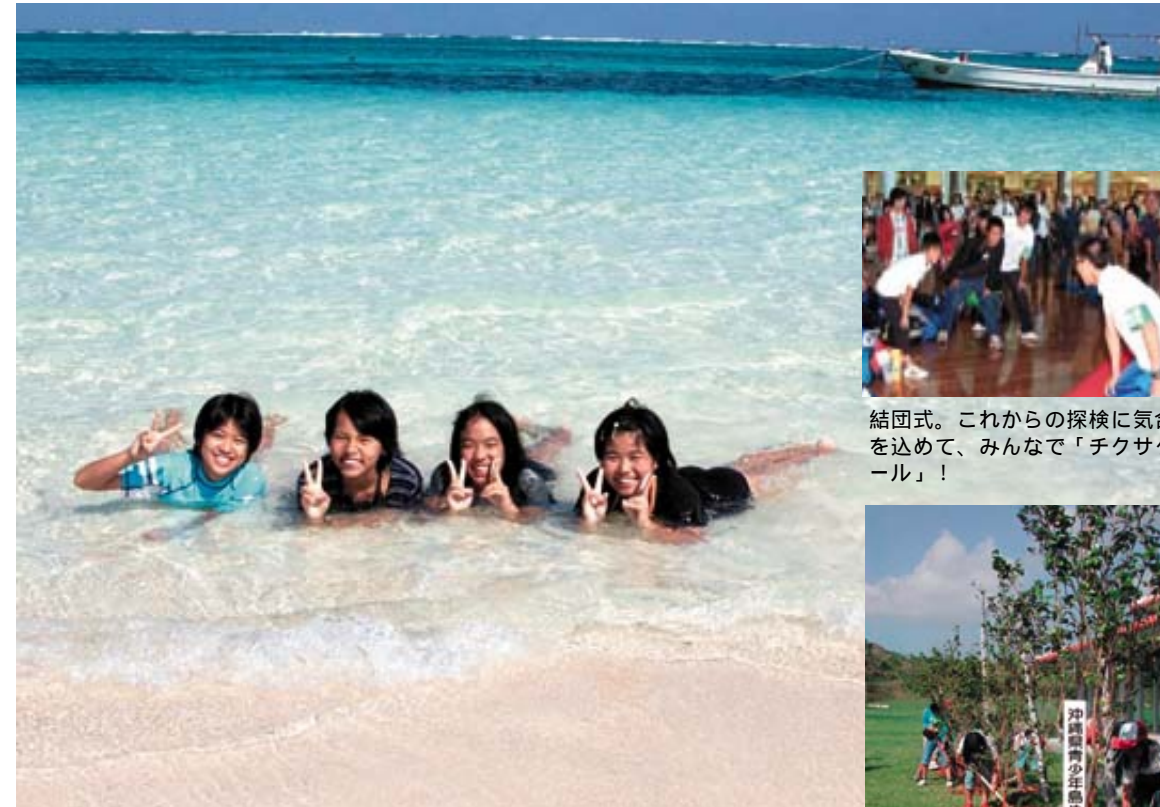
久米島にある、砂浜だけの島・はての浜で、ピース