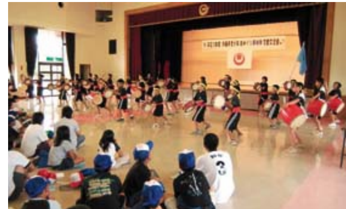
久米島の子もたちのエイサー。小さな子も大きな子も、すごく、すごくうまい。息がびったりあっているよ