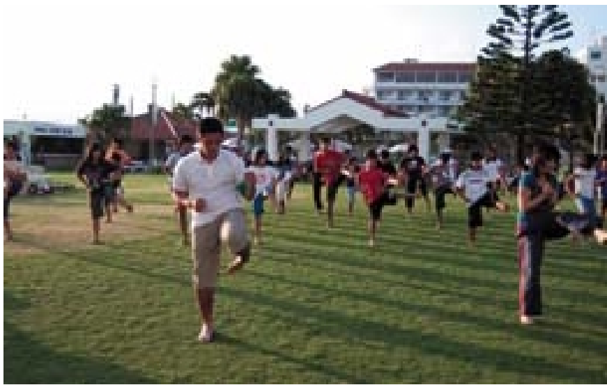
楽しい体験の後、明日の久米島の子もたちとの交流会のために演技練習。みんな一生けんめい、できるまでがんばりました

事前研修:平成15年9月23日(火) 於:沖縄県総合運動公園レクリエーションドーム オリエンテーション・体験学習準備・レクリエーション 事後研修:平成15年12月23日(火) 於:沖縄県総合運動公園体育館 アルバム配布・寄せ書き・作文発表・レクリエーション