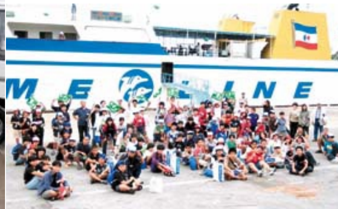
なごりおいしい、久米島からの出発の前に。「ハイ。チーズ」