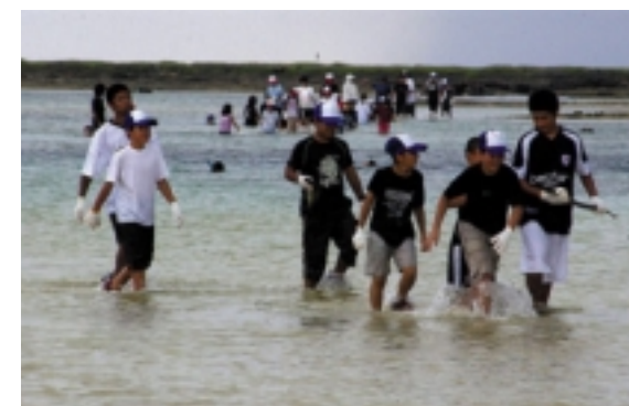
交流会の後は、追い込み漁体験。雨が時々降ったけど、魚はしっかり捕りました