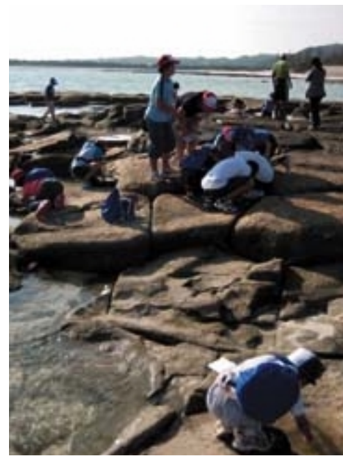
久米島にしかない、畳石でイノー観察会

歓・交流会を通して友情を育みました。また追い込み漁やイノー(礁池)観察、天体観察などの体験活動を行い、島の文化や歴史、自然を学びました。その「島めぐり探検」を写真で紹介いたします。