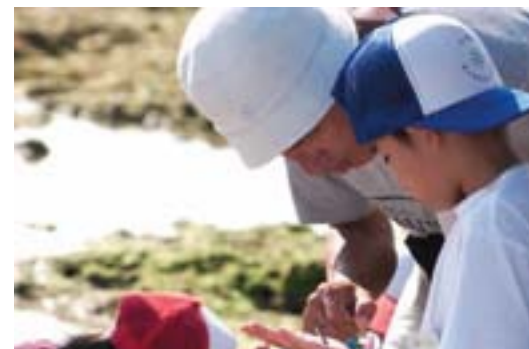
見たことない生きもの。なんだろう?