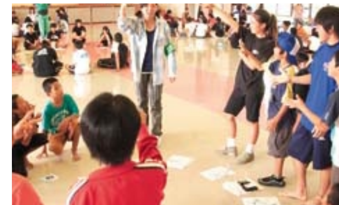
演技の後は、探検隊、久米島の子と一緒にゲームを楽しんだよ。友だち何人作れたかな