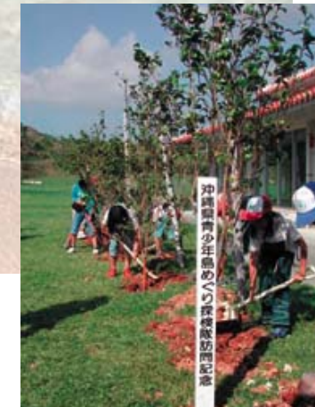
久米島での記念植樹。ぼくらの孫がぼくらぐらいの年になったとき、これをみられるといいな