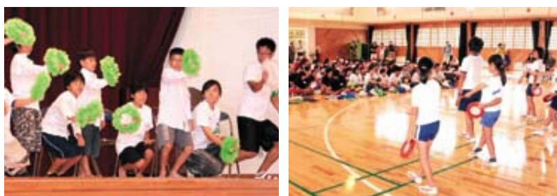
渡名喜島の子のエイサーも、探検隊の子のダンスも、みんなで楽しみました