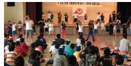
久米島の子もたちに負けずに見せました。大きく「エイ！」