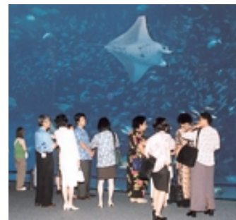
美ら海水族館での首脳夫人一行