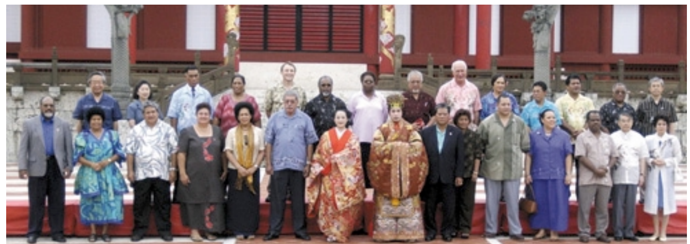
首里城正殿前での記念撮影