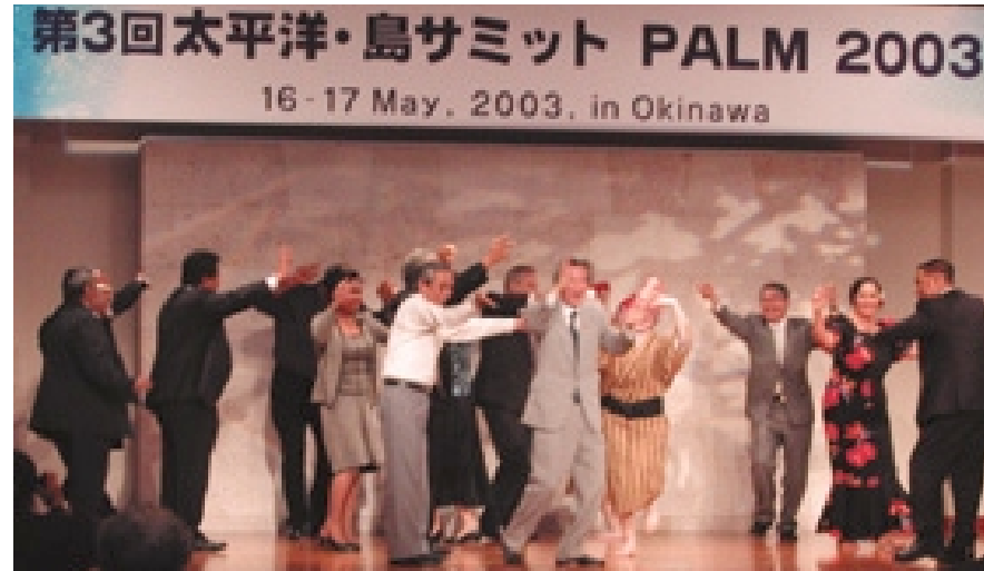
カチャーシーを踊る首相・知事ほか