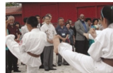
空手演舞を見る知事と首脳一行