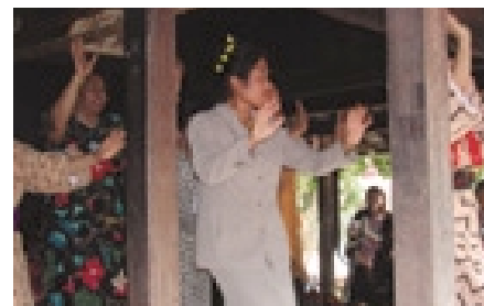
琉球村でカチャーシーを踊る婦人たち