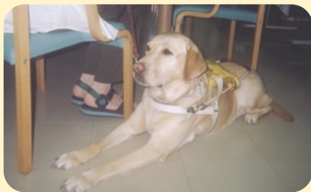
お仕事の盲導犬イレーヌ

補助犬とは、体の不自由な人を助けて一緒に生活する犬のことで（盲導犬、聴導犬、介助犬の3種類）。今年の10月から、法律により、お店やホテルなどは、補助犬の同伴の受け入れが義務付けられます。