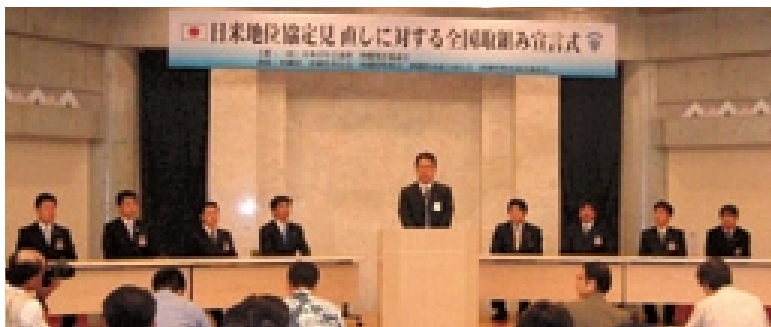
「日米地位協定見直しに対する全国取組み宣言式」日本青年会議所

この協定の実施に関する日米間の協議機関として、日米合同委員会を設置しています。（第25条）