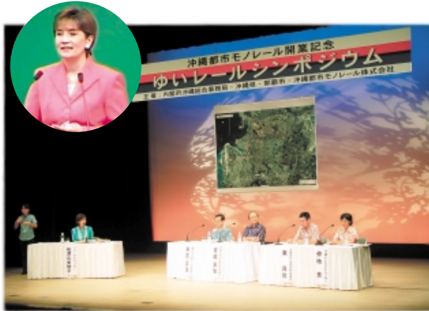
円内は基調講演のマリ・クリスティエヌさん

7月5日、モノレール開業を記念したシンポジウムが、「ゆいレールへの期待」をテーマに、那覇市のパレット市民劇場で開催された。異文化コミュニケーションのマリ・クリスティエヌさんが「モノレール駅を中心に発展する夢の街づくり」と題し講演。引き続き行われたパネルディスカッションでは、4人のパネリストたちが、屋上緑化や駅周辺活性化への取り組み、観光への明るい展望など、それぞれの立場から提言や意見を出し合った。