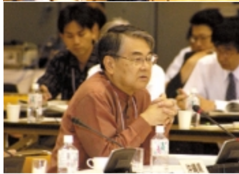
岐阜県で開催された全国知事会議（写真上下）

日米地位協定の問題を全国的課題として、見直しを求める機運を盛り上げるため、県では「全国行動プラン」を進めています。新聞・テレビでも話題になる、この日米地位協定の問題点は何か、そして最近の動きをご紹介します。