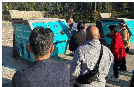
【熊被害を削減するために設置されたごみ箱】