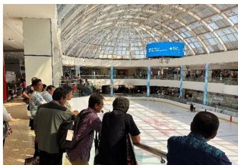
【屋内アイススケートリンク】