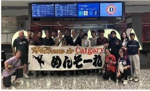
【Calgary Okinawan Club の皆様と議員団】