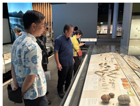
【先住民の暮らし展示を視察する様子】