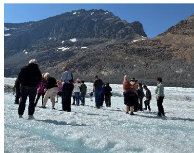
【氷原ツアー参加者の様子】