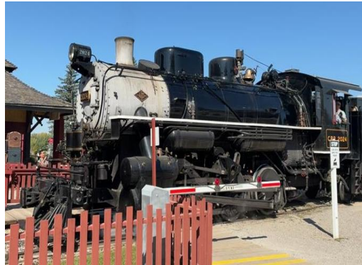
【蒸気機関車に乗車し施設内を視察】