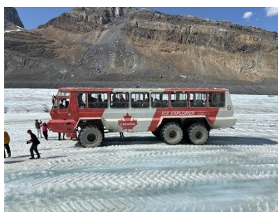
【1台 50名乗りの氷上バス】