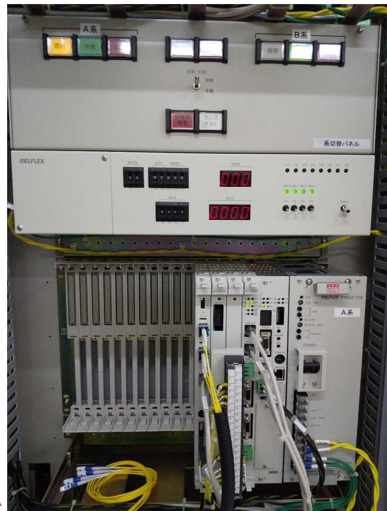
宜野湾浄化センター 遠方監視制御盤(TM-01) 盤内 (宜野湾浄化センター 管理棟 1F電気室)