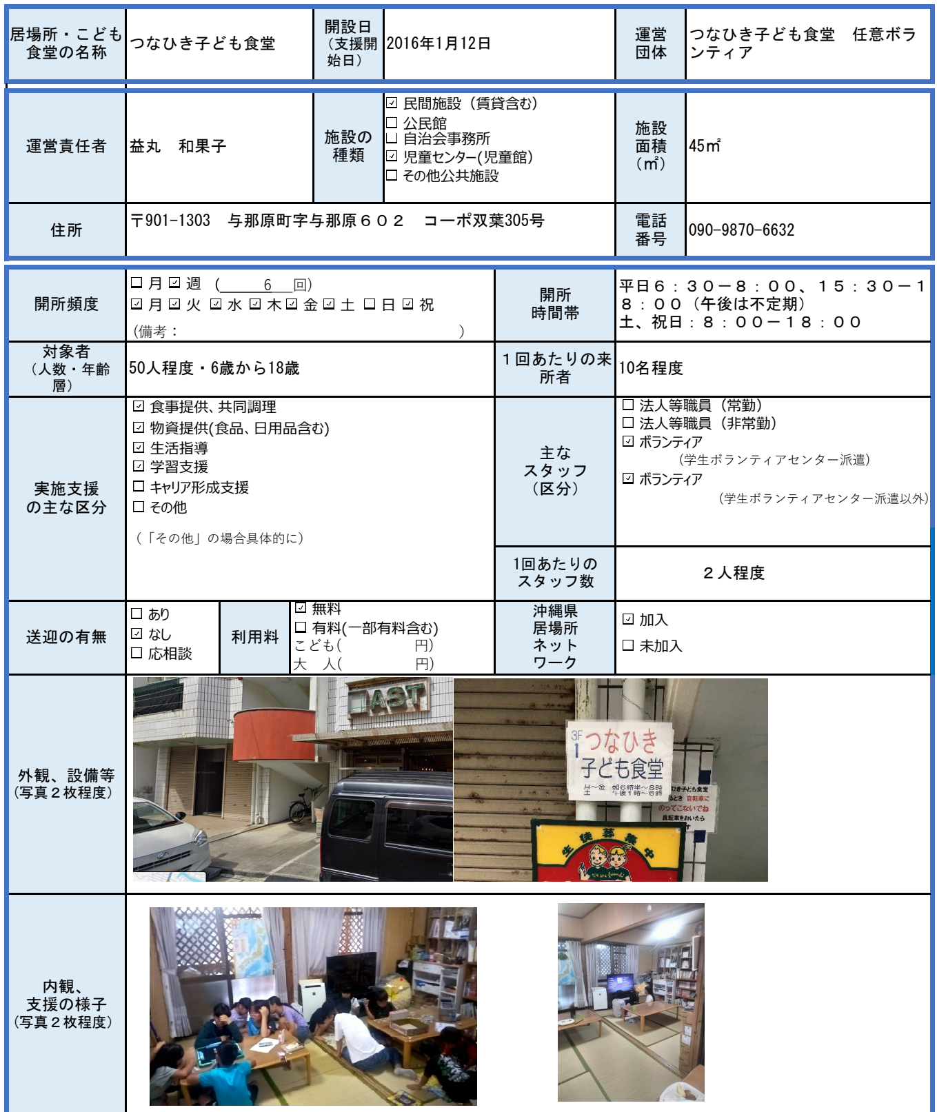
様式 1 こどもの居場所・こども食堂実施状況（個票）