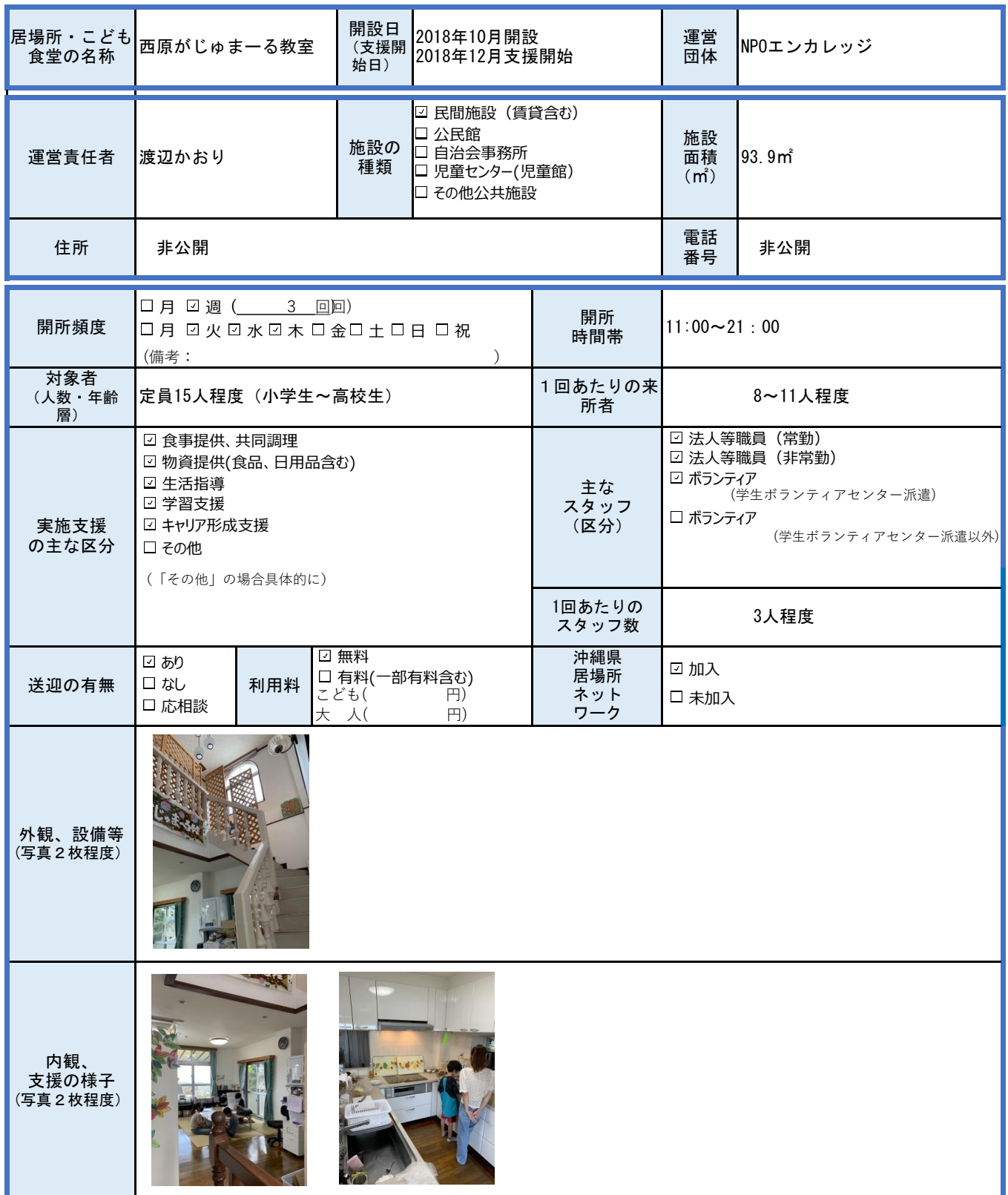
様式 1 こどもの居場所・こども食堂実施状況（個票）