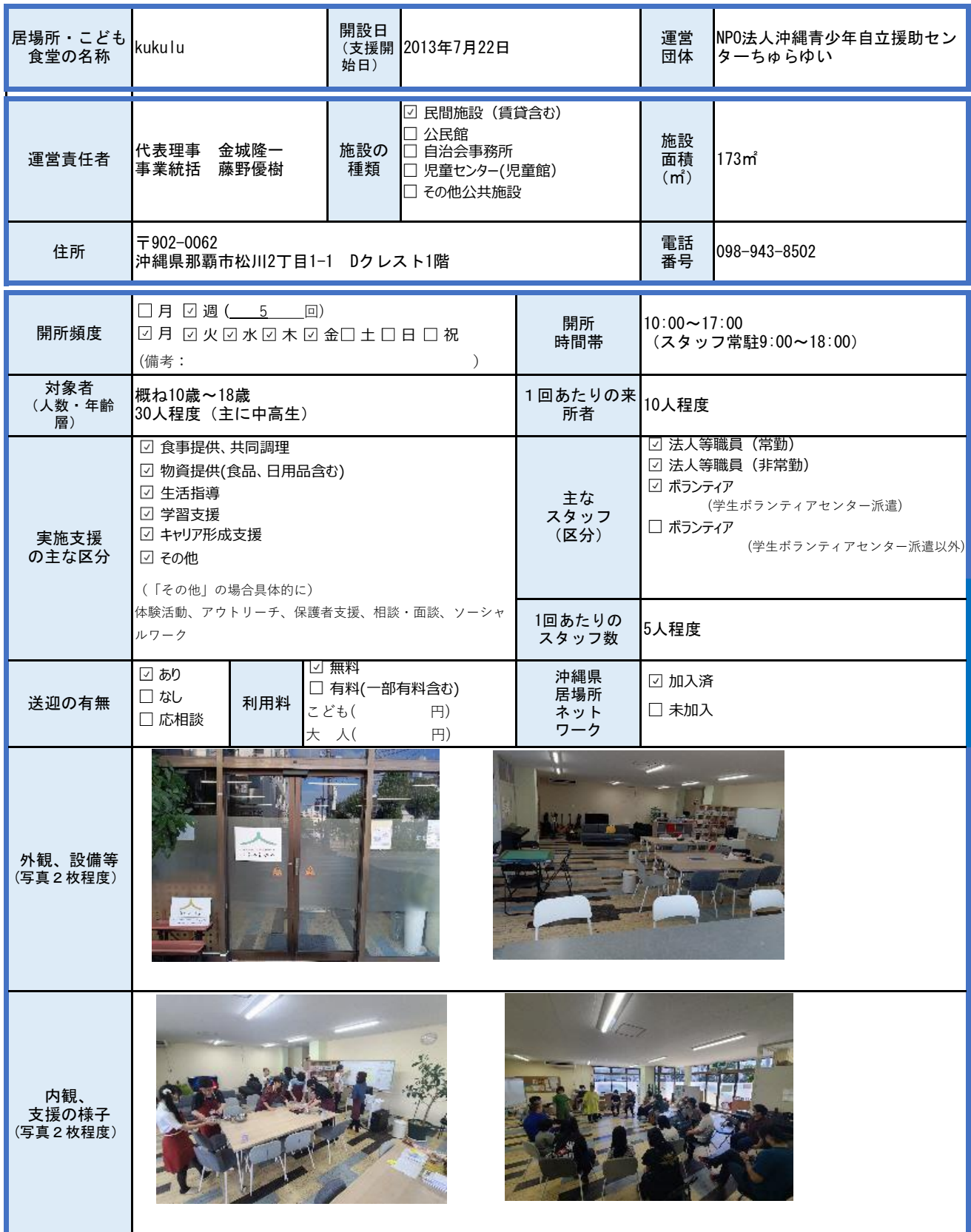
様式1 こどもの居場所・こども食堂実施状況（個票）