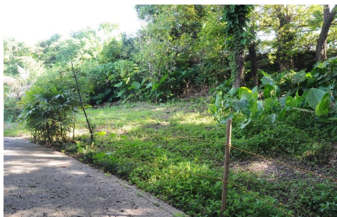
龍潭西側 調査区Ⅲ（北東から）