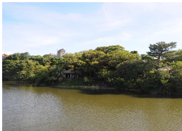
龍潭西側遠景（北から）