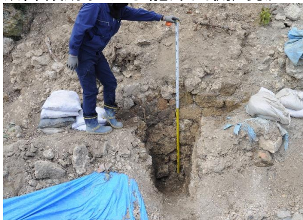
中城御殿跡 石積検出状況（東から）