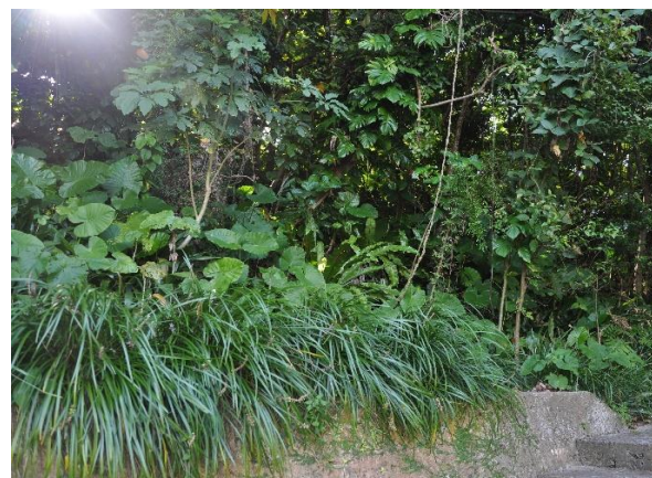
龍潭西側 調査区Ⅱ（南東から）