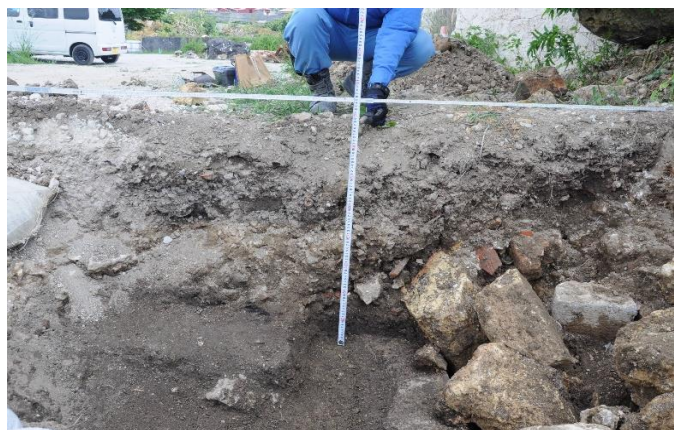
中城御殿跡 試掘箇所南壁（北から）