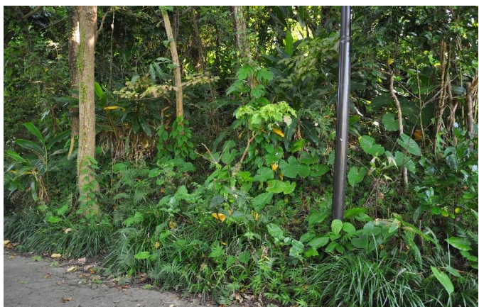
龍潭西側 調査区Ⅰ（北東から）