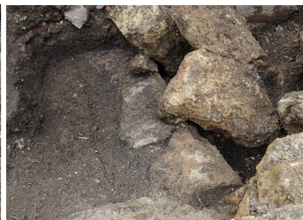
中城御殿跡 暗渠検出状況（北から）