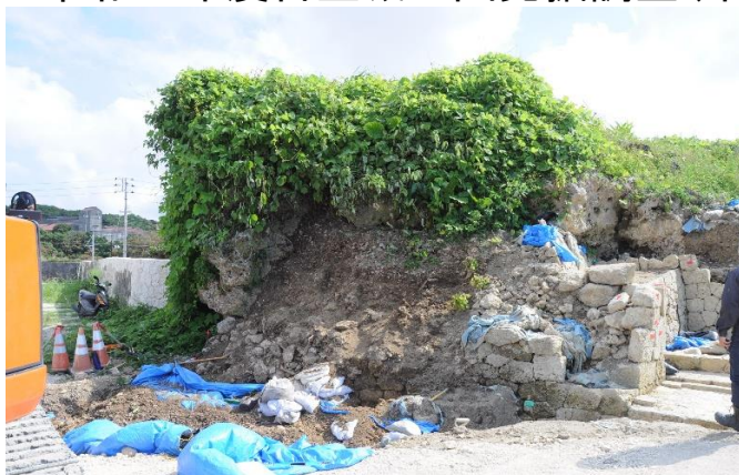
中城御殿跡現況（北東から）