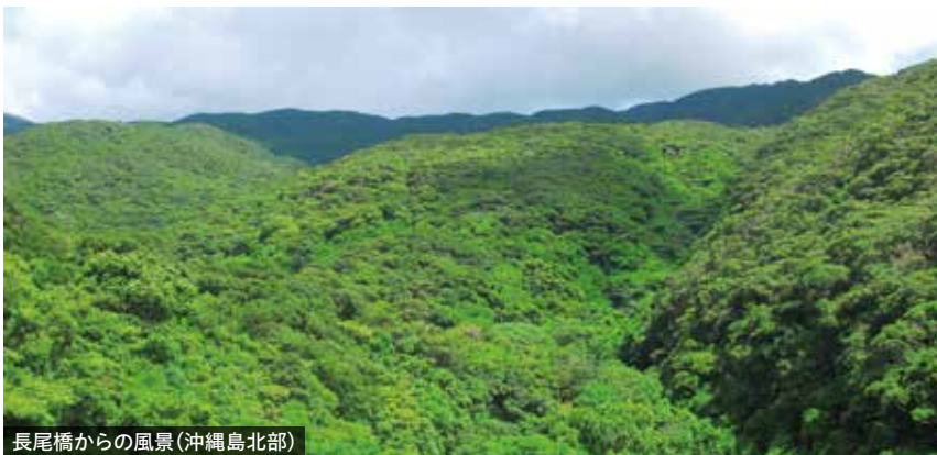
長尾橋からの風景(沖縄島北部)

7月25日(土)、26日(日)は、世界自然遺産4地域(奄美大島、徳之島、沖縄島北部及び西表島)の魅力や環境保全の取組について紹介するほか、各地域の特産品を販売する物産展を那覇市内で行います。遺産登録日である26日には、4地域からゲストを招きシンポジウムを開催します。まだ遺産地域を訪れたことのない方にも、その地域の価値や魅力、保全の大切さが感じられるような内容をお届けし、遺産への理解を深めていただく機会を創出したいと考えています。皆さまのご来場をお待ちしています。