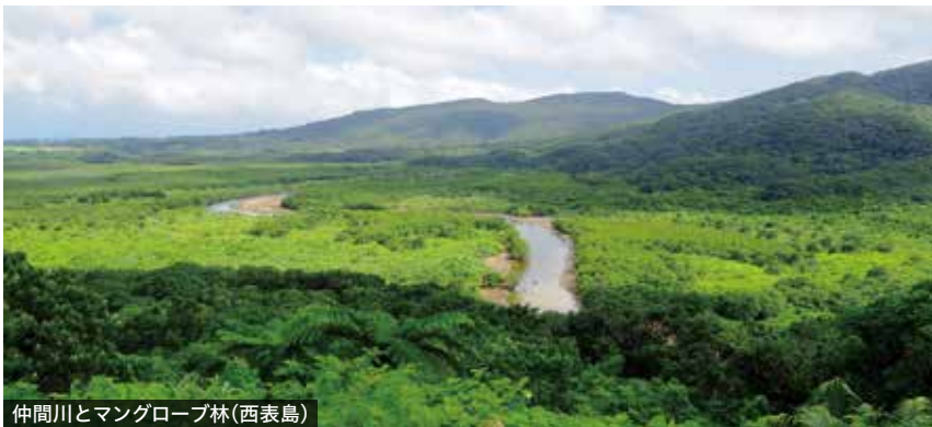
仲間川とマングローブ林(西表島)