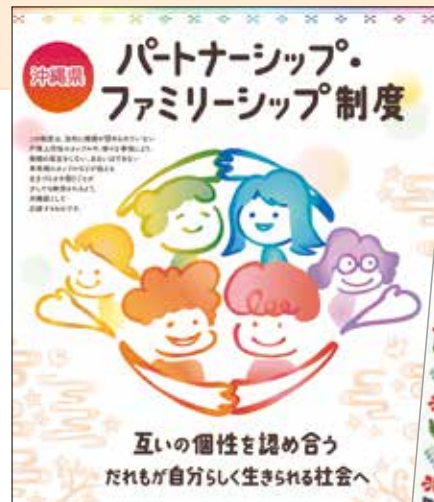
性の多様性に関する絵本▶

「受理証明書」を提示することで、公営住宅の入居申し込み、携帯電話の家族割引、各種ローンや保険、マイルの合算などにおいて、婚姻と同様の対応が受けられます。※法的な効力(相続、税金の控除など)が生じるものではありません。