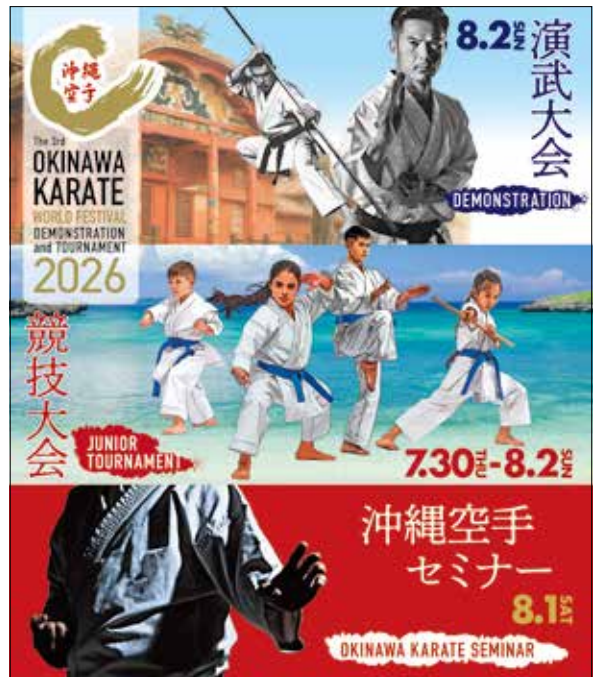
沖縄空手世界大会公式ホームページ

また、大会期間を含む7月28日(火)から8月3日(月)の7日間を「沖縄空手ウィーク」と位置付け、沖縄空手会館を無料開放し、多彩な関連イベントを開催します。空手関係者だけでなく、子どもから大人までどなたでも楽しめる内容となっていますので、ぜひ会場へ足をお運びください。