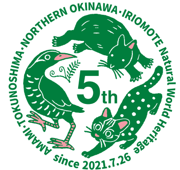
奄美大島、徳之島、沖縄島北部及び西表島 世界自然遺産登録5周年