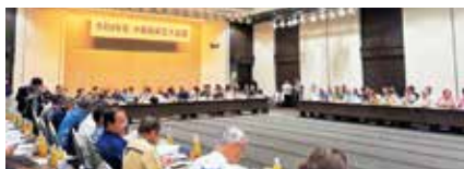
令和8年度沖縄振興拡大会議

令和8年度沖縄振興拡大会議を開催しました。県内の市町村長や議会議長、県幹部が沖縄県市町村自治会館にて一堂に会し、「地域が連携した高齢者の支援」および「全額県費負担による学校給食費無償化の実現」をテーマに、意見交換を行いました。