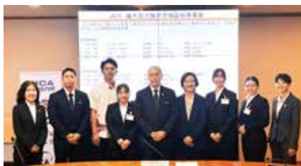
表敬訪問メンバーと宮城副知事

JICA海外協力隊として派遣国に出発する隊員4名と帰国隊員3名が県庁を訪れ、宮城副知事を表敬しました。 副知事は各隊員へ激励の言葉を贈り、沖縄と派遣国をつなぐ存在として活躍することに期待を寄せました。 県では、JICA海外協力隊員を「おきなわ国際協力大使」として任命し、