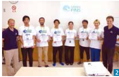
1 漁協のもずく養殖の鉄筋へのサンゴ着生からヒントを得て始めたサンゴ養殖。 2 「アセサー」と呼ばれるGreen Fins認定員 3 Green Finsガイドラインポスター

2018年から「サンゴの村宣言」をしている恩納村では、サンゴや取り巻く環境を守り、発展し続けることのできる社会へ向けて村全体で取り組んでいます。そのひとつに「Green Fins」というサンゴ礁保全の国際的な取組があります。