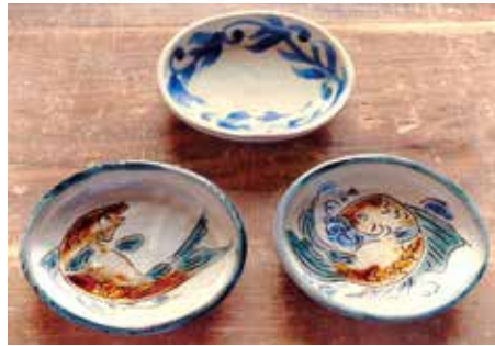
工業技術センターとの共同研究や技術支援により開発された商品

また、県工業技術センターでは、製品や試作品の試験検査を行ったり、企業からの相談を受け、共同研究や技術指導を行ったりすることにより、新たな製品の開発や技術の導入などのサポートを行っています。 ほかにも、県では生産性を向上させるために新たな機械の試作や技術の研究を行う企業への支援や、県外へ発注されている加工などの業務を県内企業が受注できるよう、企業間のマッチングにも取り組んでいます。