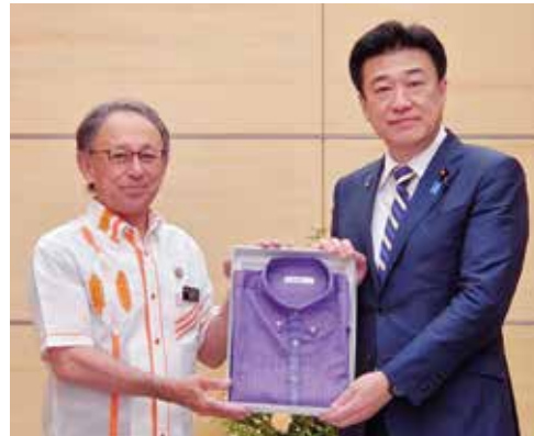
玉城知事から木原官房長官へのかりゆしウェアの贈呈

沖縄のビジネスやフォーマルな場でおなじみの「かりゆしウェア」。その定義は、「県内の認定工場などで縫製された沖縄らしいデザインの衣料品」とされています。近年では、半袖や長袖のシャツに