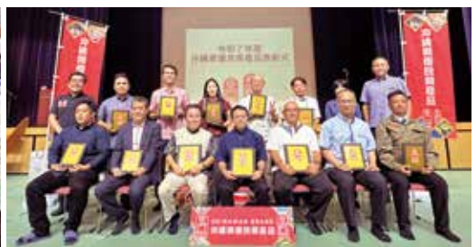
令和7年度表彰式/産業まつり会場にて