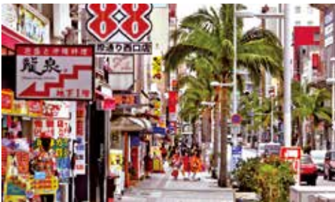
沖縄を訪れる多くの観光客でにぎわう国際通り。そこには、たくさんの土産店が軒を連ねる