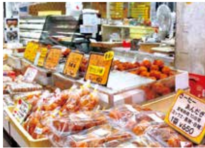
昔から愛されてきたお菓子は 今ではすっかり沖縄旅行の定番土産に

今回分かったことは、お土産選びは「どの商品が良いか」だけでなく「どこで買うか」も大きく影響するという。単に商品を並べるだけでなく、活気やにぎわい、その地域ならではの生活感といった「その場しか味わえない」雰囲気を作ることが、観光客から選ばれる店舗づくりの鍵となります。