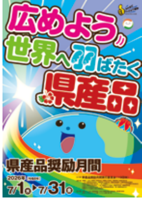
県産品奨励月間ポスター

積極的な県産品の愛用は、域内経済循環を高め、地場産業の振興・発展に大きく寄与するとともに、雇用の待遇改善・創出・確保など地域活