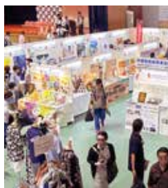
産業まつり会場内展示