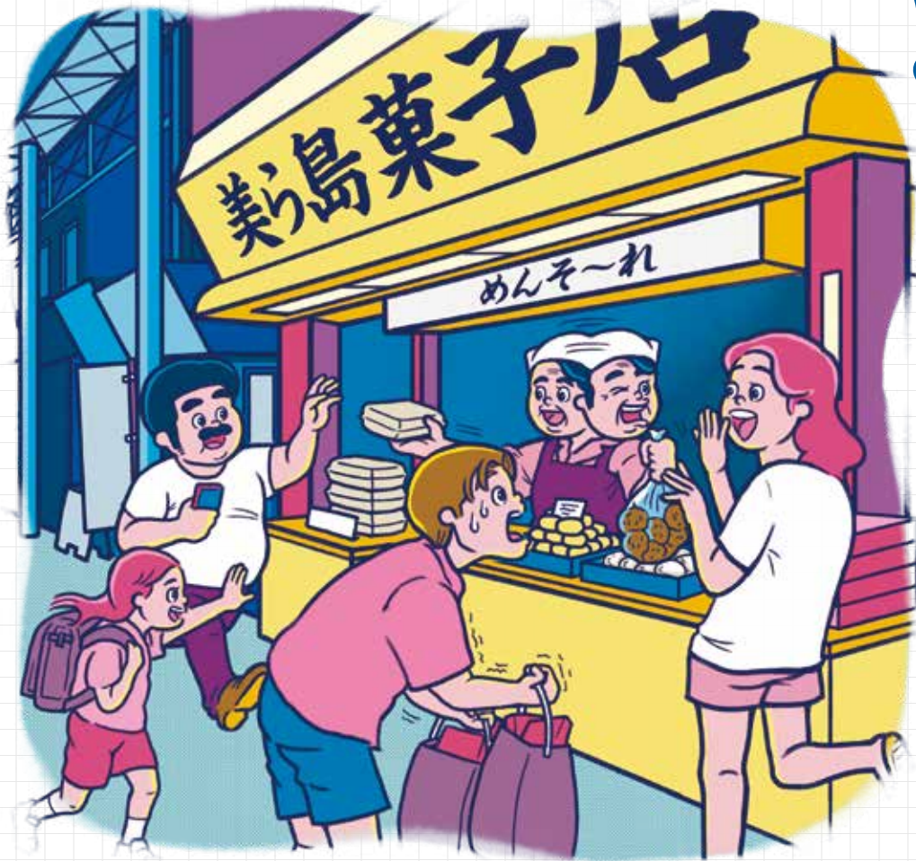
店主との何気ないやりとりも、お土産を買う決め手の一つになりそう。