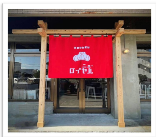
■店舗外観(ニューロイヤル)