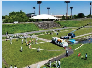
■ドローン操作研修