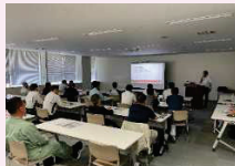
■経営者向けセミナー