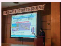
■事例研究発表会(県内業者)