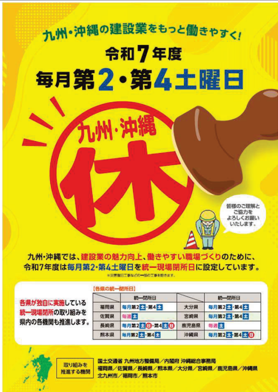
【令和7年度の九州・沖縄ブロック統一ポスター】

～ 令和7年度は“毎月第2・第4土曜日”を統一現場閉所日に設定～ さらに各県が独自に実施している統一現場閉所の取り組みを県内の各機関※も推進します