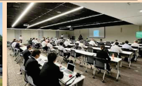
■経営者向け意識改革セミナー