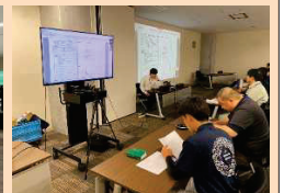
■リモート査定研修