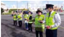
警察と防犯ボランティアが連携した年金支給日における防犯活動