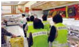
自主防犯ボランティア団体との合同パトロール

年末・年始は、にぎやかな行事やイベントが数多く行われるなど、経済活動や人々の移動が活発化します。その一方で、金融機関やコンビニなどを対象とする強盗、高齢者や女性を狙ったひったくり、公的機関職員を名乗って金銭をだまし取ろうとする特殊詐欺、重大な交通事故につながる飲酒運転、初詣における雑踏事故などの発生が懸念されます。