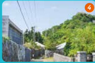
4 島には浜と比嘉の二つの集落があり、どちらも赤瓦屋根の家並みや石垣といった昔ながらの集落が残っている。

多くの神話が残る島で パワースポットめぐり 闘牛や伝統エイサーなど文化や芸能が盛んなうるま市。人気のドライブコースである海中道路の先には四つの島が橋でつながっています。 そのうちの一つ浜比嘉島は、古くから「神の眠る島」という言い伝えがあり、各所で聖域とされる場所に出会うことができます。また、島には古民家や石垣といった昔ながらの集落が残っていて、ノスタルジックな雰囲気を味わいながら歩くと、ガイドブックには載っていない島の魅力に触れます。