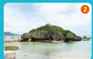
2 琉球を創ったと伝えられる女神アマミチューと男神シルミチューをはじめとする神々が眠るアマミチューの墓。