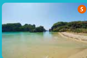
5 シルミチューの手前にある浜は透明度が高く、白い砂浜が特徴。海を眺めながら爽やかな潮風に吹かれてひと休み。