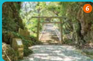
6 鳥居の奥は、琉球開びやくの男女二神シルミチューとアマミチューが住み、子どもを授かったとされるパワースポット。