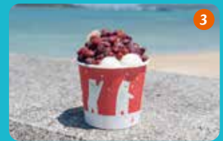
3 パーラーに立ち寄って沖縄ぜんざいを購入。冷たい氷とすっきりとした甘さの金時豆はベストコンビ!白玉も美味。