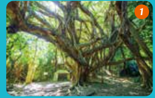
1 浜比嘉大橋を渡ってすぐの場所にある御嶽は、東(あがり)の御嶽「シヌグ堂」。ガジュマルが生い茂った神秘的な場所。