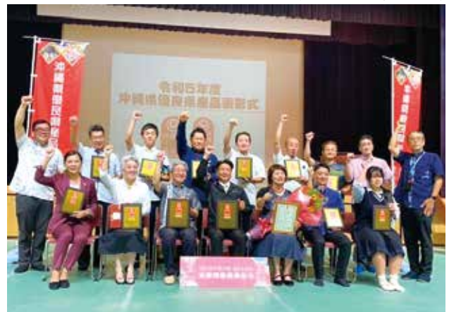
令和5年度表彰式の様子

沖縄の産業まつりで表彰式を行い、展示イベントを実施します。また、県内外小売店などでのプロモーションイベントや、商談の設定など、優良県産品の販路拡大に向けた各種支援を行います。