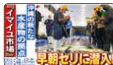
「イマイユ市場」に潜入 / 海と日本PROJECT in 沖縄県