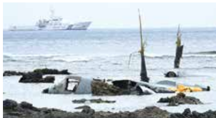
名護市オスプレイ墜落事故(2016年)

しかしながら、米軍による基地使用のあり方や米軍の地位について定めた日米間の条約である「日米地位協定」の存在が、このような問題の解決を難しくしています。同協定には、日本側の米軍基地への立入り権が明記されていないことや、米軍による訓練・演習を日本側が規制できないといった課題が指摘されています。また、過去には、基地内に拘束されていた米軍人の被疑者が国外に逃亡するといったこともありました。このため県は、日米地位協定の見直しを日米両政府に求めています。