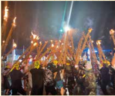
22年ぶりに行われた金武町金武区の「テービー」。火のついたたいまつを激しく叩き合った。

沖縄には、特色ある伝統行事や祭祀、文化が地域ごとに受け継がれています。南城市久高島の「イザイホー」や宮古島市狩俣の「祖神祭(ウヤーン)」のように、後継者不足のため、現在は執り行われていない祭祀もあります。過疎化が進み、担い手が不足する中で、先人た