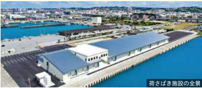
荷さばき施設の全景

泊漁港（那覇市）にあった沖縄県漁連市場の老朽化や泊漁港内の土地の狭さなどの諸問題を解決するために、県は糸満漁港（糸満市）に高度衛生管理型荷捌施設を整備しました。この施設を活用し、水産物を取り扱う地方卸売市場（愛称：イマイユ市場）が令和4年10月に開設されました。