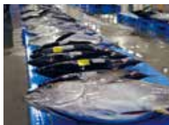
マグロなどの陳列