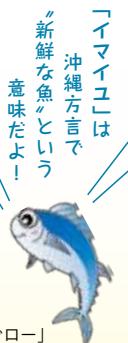
お魚キャラクター「まぐろー」

問い合わせ 水産課 電話：098-866-2300 FAX：098-866-2679