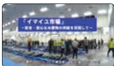
イマイユ市場 / 沖縄県漁業協同組合連合会