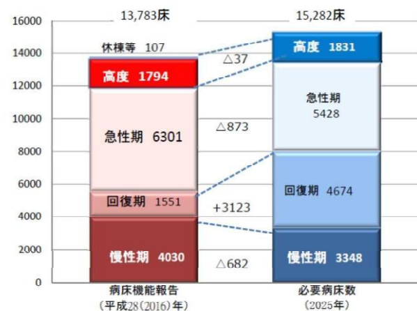
図2 平成 28(2016)年の病床機能報告（許可病床数）と 2025 年における必要病床数との比較

特に、不足が顕著である回復期機能については、病床機能の転換による確保を支援し、将来見込まれる医療需要に適切に対応できるようバランスのとれた医療提供体制の構築を促進します。