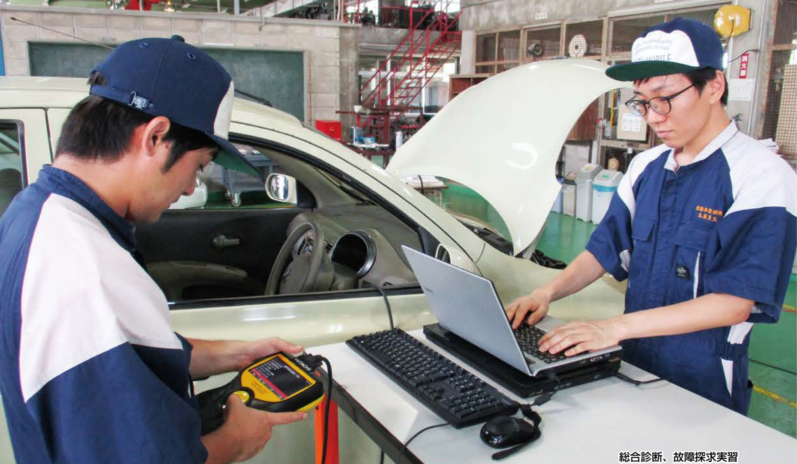
総合診断、故障探求実習