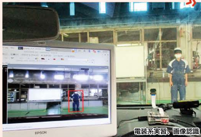
電装系実習、画像認識