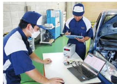
電装系実習、充電制御