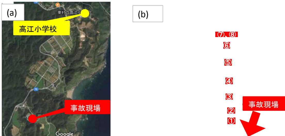
図1. (a)事故現場と高江小学校との位置図、(b)高江小学校敷地拡大図