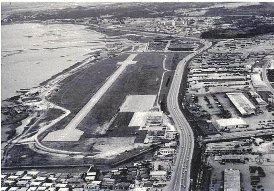
1972（昭和47年）5月撮影