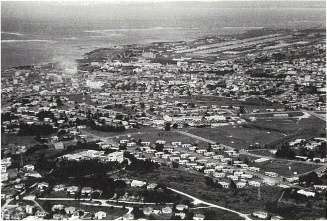
1972（昭和47年）5月撮影