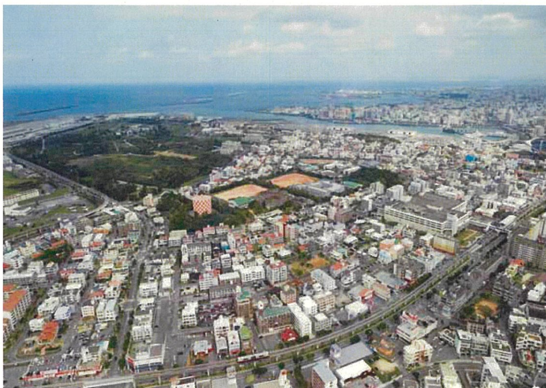
2017 (平成29年) 1月撮影。