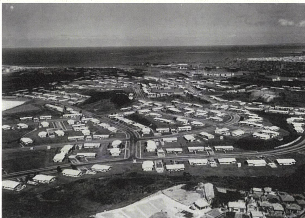
撮影年不明