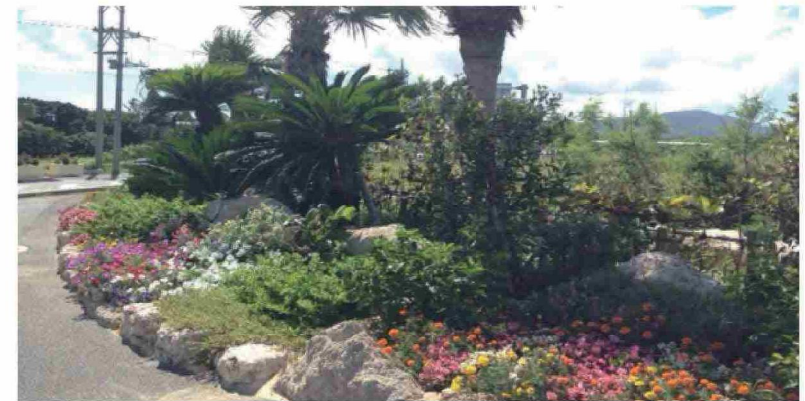
沖縄フラワークリエーション事業