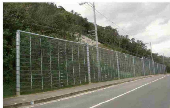
道路防災保全事業(管理)(県道79号線:伊原間)