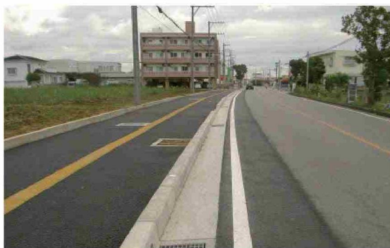
公共交通安全事業(国道390号:大浜)