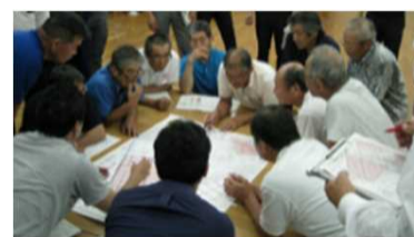
将来の目標地図例