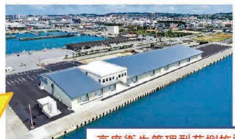
高度衛生管理型荷捌施設