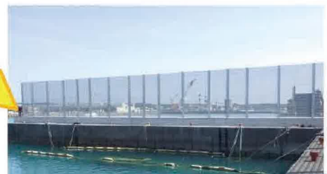
避難水域の安全係留に資する防護柵