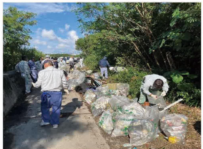
ボランティアによる清掃作業の様子