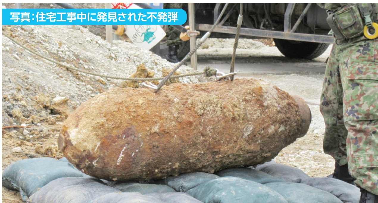
写真：住宅工事中に発見された不発弾