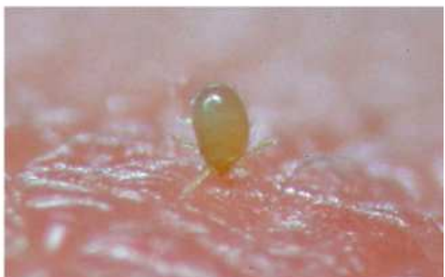
写真3. ヒトの肌に吸着するツツガムシ