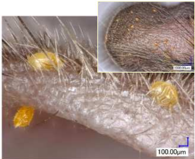
写真2. ネズミの耳に寄生するツツガムシ