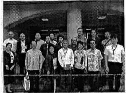
子どもの未来応援特別委員会 東京視察 (足立区 舎人第一小学校)

乳幼児期の子供の貧困に対する支援については、県としても大変重要だと認識しており、子供の貧困対策計画のほうにも位置付けております。調査結果を踏まえ、関係機関と連携し、さらなる子供の貧困対策の充実を図ってまいります。