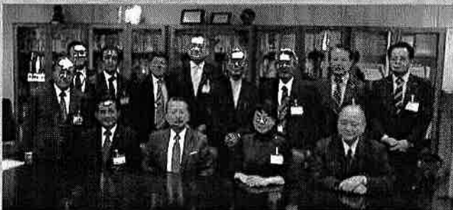
スペイン・バルセロナ日本国領事館