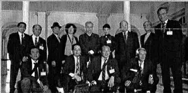
ポルトガル・リスボン国立自然博物館