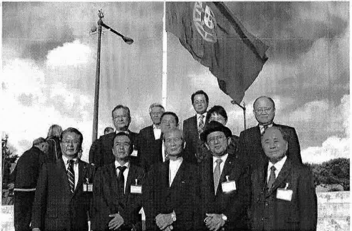
H29.10.30～11.6 土木環境委員会海外視察（ポルトガル・スペイン）

うりずんの頃、県民の皆様におかれましては益々ご健勝のこととお慶び申し上げます。 平和で誇りある豊かな沖縄づくりに実現に向け、県議会会派「おきなわ」の仲間と共に県勢発展の為、議会活動に取り組み早、6月で2年を迎えることとなります。