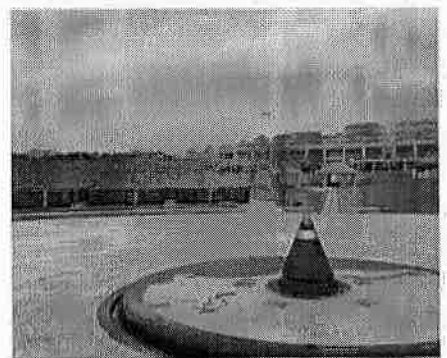
糸満市摩文仁 平和の礎

世界遺産の登録は、文化財保護法に基づき国の指定文化財になることが必要となります。その上で、世界遺産の登録基準に該当しているか、文化庁での審議を経て、国内暫定一覧に記載される必要があります。県教育委員会としては、文化庁の指導を仰ぎながら、こうした条件を満たすことができるかどうかなど、世界遺産の資産の対象となる戦争遺構が所在する市町村との意見交換を行いたいと考えております。