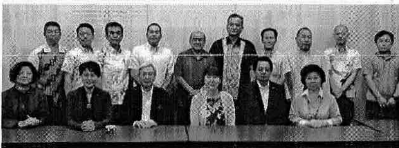
H29.6.9 子どもの未来応援特別委員会 東京視察 (立教大学)