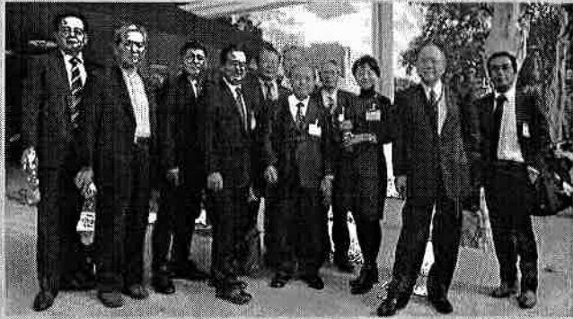
ポルトガル日本大使館