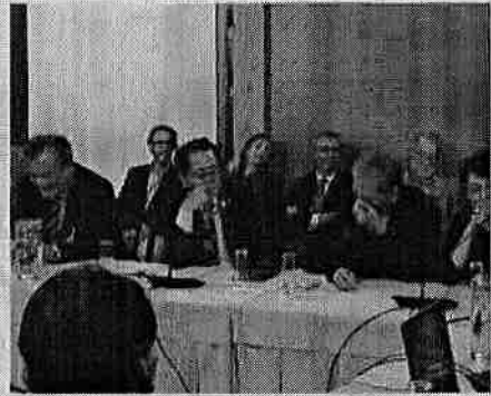
ポルトガル・リスボン市庁舎