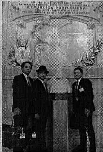
ポルトガル・リスボン市庁舎