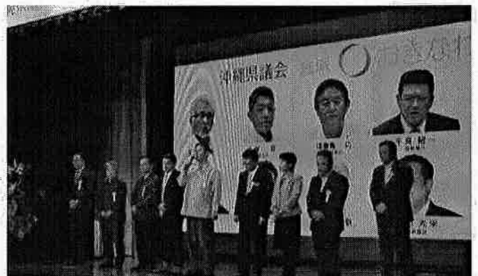
H29.11.24 会派おきなわ報告会