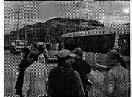
H29.12.14 土木環境委員会 県内視察 (倉敷環境)