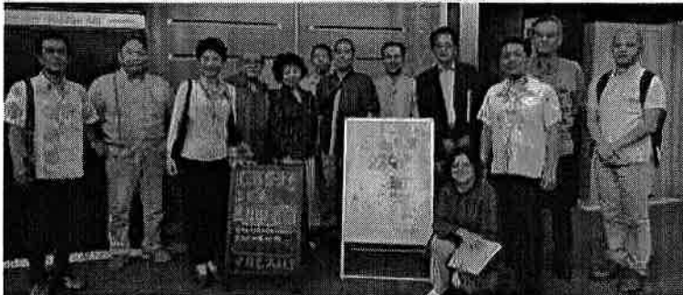
H29.6.9 子ども未来応援特別委員会