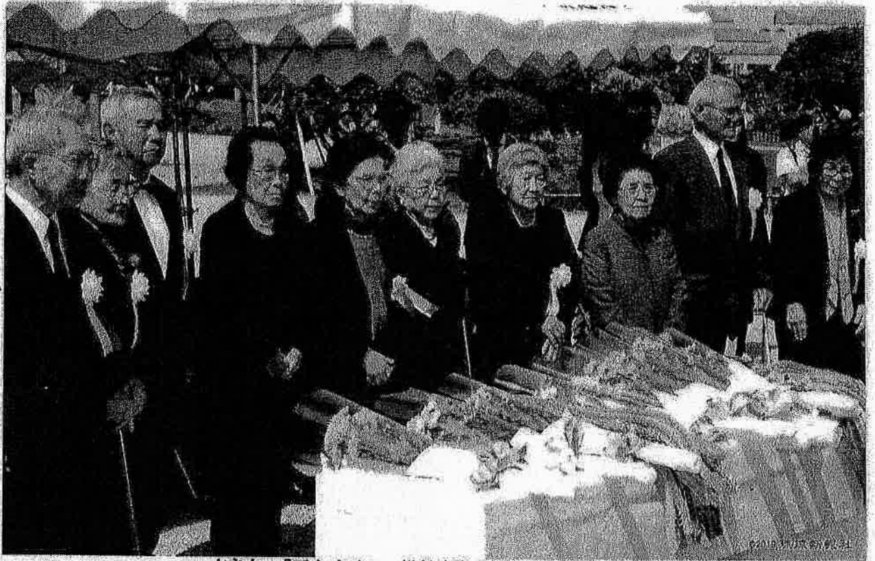
亡き友へ「平和を守る」犠牲者数明記 元学徒ら誓い新た 除幕式で献花した「元全学徒の会」のメンバー＝3月14日午後、糸満市摩文仁の平和祈念公園 (2019年3月15日 金曜日 琉球新報 朝刊 社会面掲載)