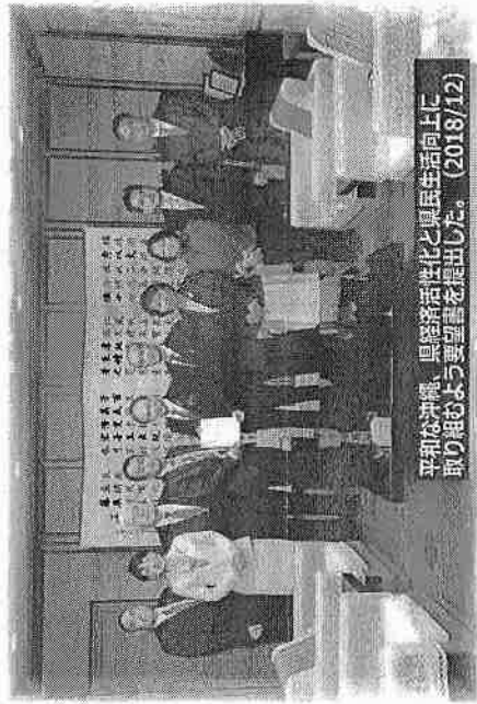
平和な沖縄、県経済活性化と県民生活向上に 取り組むよう要望書を提出した。(2018/12)