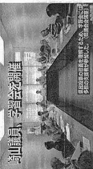
岡山議員、学習会を刺激 県民投票の意義を理解するため、学習会には多数の支援者が参加した。(県議会議員)