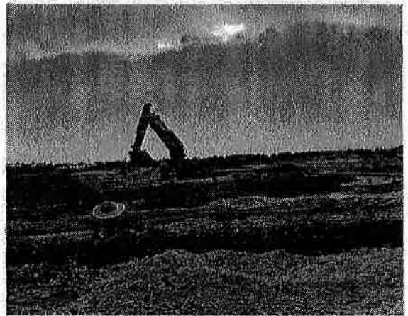
宮古島城辺保良地区築城自衛隊弾候補地 (保良鉾山)