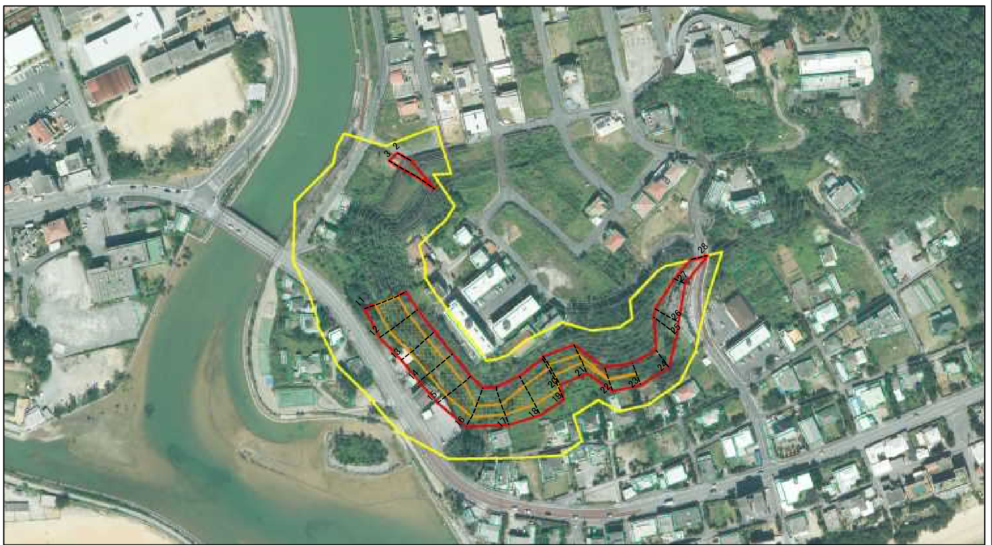
図中の数字は横断測線番号を示す