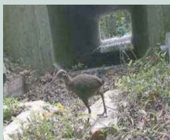
県道2号線のアンダーパス

本島北部のやんばる地域は、亜熱帯の森林が広がり、ヤンバルクイナ等の多くの固有種が生息していますが、その稀少動物が路上へ出現し、交通事故にあっています。