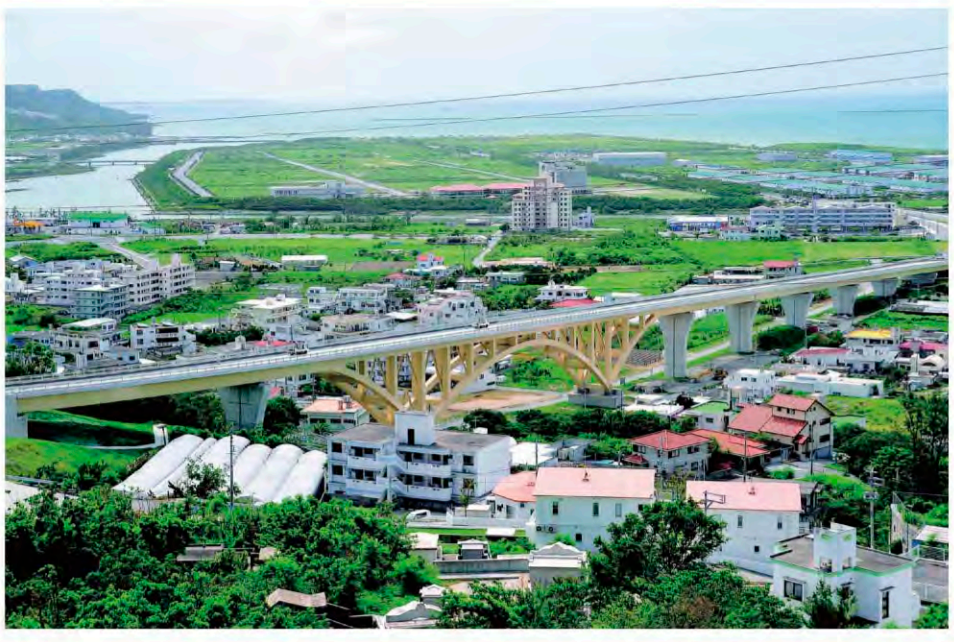
一般県道 県道36号線(なかさす大橋)