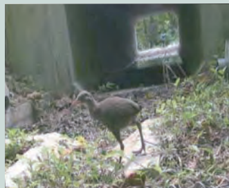
県道2号線のアンダーパス

本島北部のやんばるの地域は、亜熱帯の森林が広がり、ヤンバルクイナ等の多くの固有種が生息していますが、その稀少動物が路上へ出現し、交通事故にあっています。