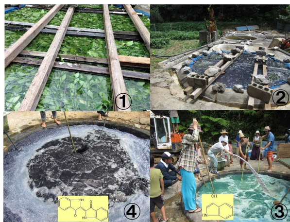
図1 藍植物の浸漬液からの泥藍(沈澱藍)の製造過程

沖縄県本部町におけるリュウキュウアイ浸漬液からの泥藍(沈澱藍)の製造過程を、図1に示した。①新鮮なリュウキュウアイの葉と幹を水に二日ほど浸漬する。②2日ほど経過して、染料成分が植物体から浸漬液に出て来る。③植物体などの固形物を除いた浸漬液に0.1%程度の消石灰(水酸化カルシウム)を添加し、同時に激しく攪拌する。④浸漬液中のインドキシルが酸化されて、藍染料(インジゴ)ができて浸漬液が濃い青色に変色してくると攪拌は止めて、藍染料を凝集沈澱させることにより泥藍を調整した。